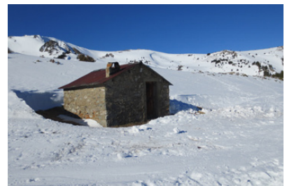
Pic de Tarbésou (2.364m) des de Mijanes