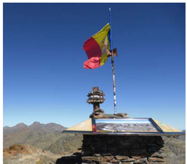
Pic de Comapedrosa (2.939m) des d'Arinsal