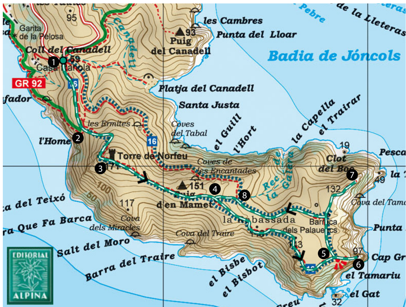
Cap de Creus. 1:25.000. Editorial Alpina.