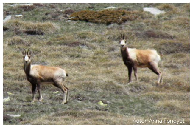
Autor: Anna Fonoyet