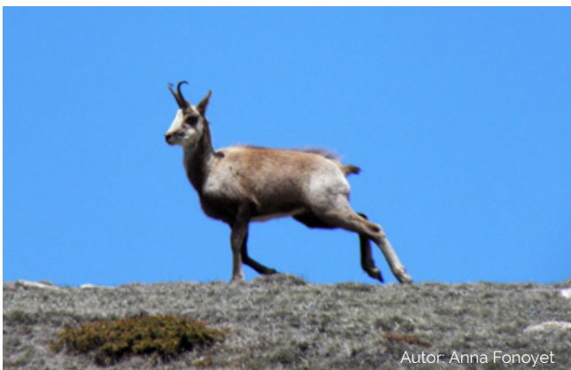
Autor: Anna Fonoyet

Després d'uns 20 minuts caminant des del refugi, 10 agafem el corriol desdibuixat (4:35h - 1.714m) que surt de la pista i baixa en direcció SO cap a l'Era del Comú. Aquest corriol es va perdent entre matolls i pedres i, en la part final, baixa en paral·lel al barranc de Malallau. Encara que el corriol es perd, la visibilitat és bona, el coll on hem d'arribar és evident a davant nostre al fons. Arribem finalment a l'ample 11 coll de l'Era del Comú (4:55h - 1.505m) i agafem una pista que puja en direcció SO deixant el turó de la Cogulla (1.623m) a la nostra dreta. Seguidament la pista fa una lleugera baixada i després continua fent una pujada suau. Ja ens trobem ben a prop del Picó Fred (1.538m) i la Rocalta (1.489m).