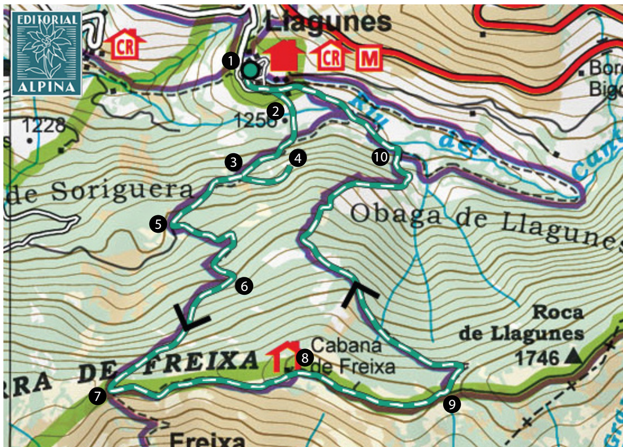
Parc Natural de l'Alt Pirineu. 1:50.000. Editorial Alpina.