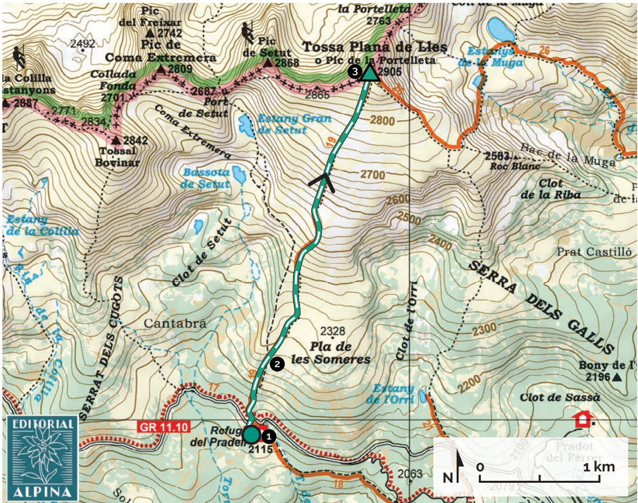
Cerdanya. Alta Cerdanya-Capcir-Andorra. 1:50.000. Editorial Alpina.