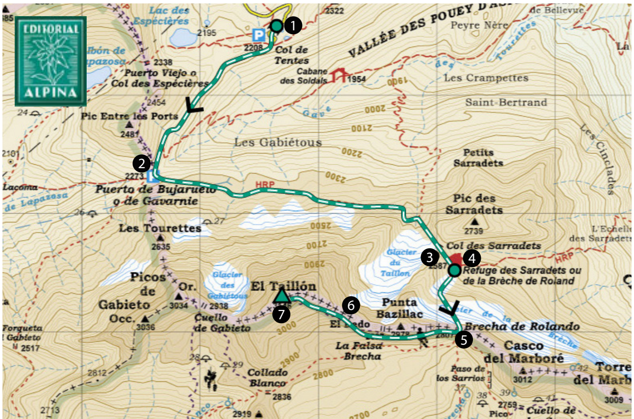
EDITORIAL ALPINA. Ordesa y Monte Perdido. Parque Nacional. 1:40.000.