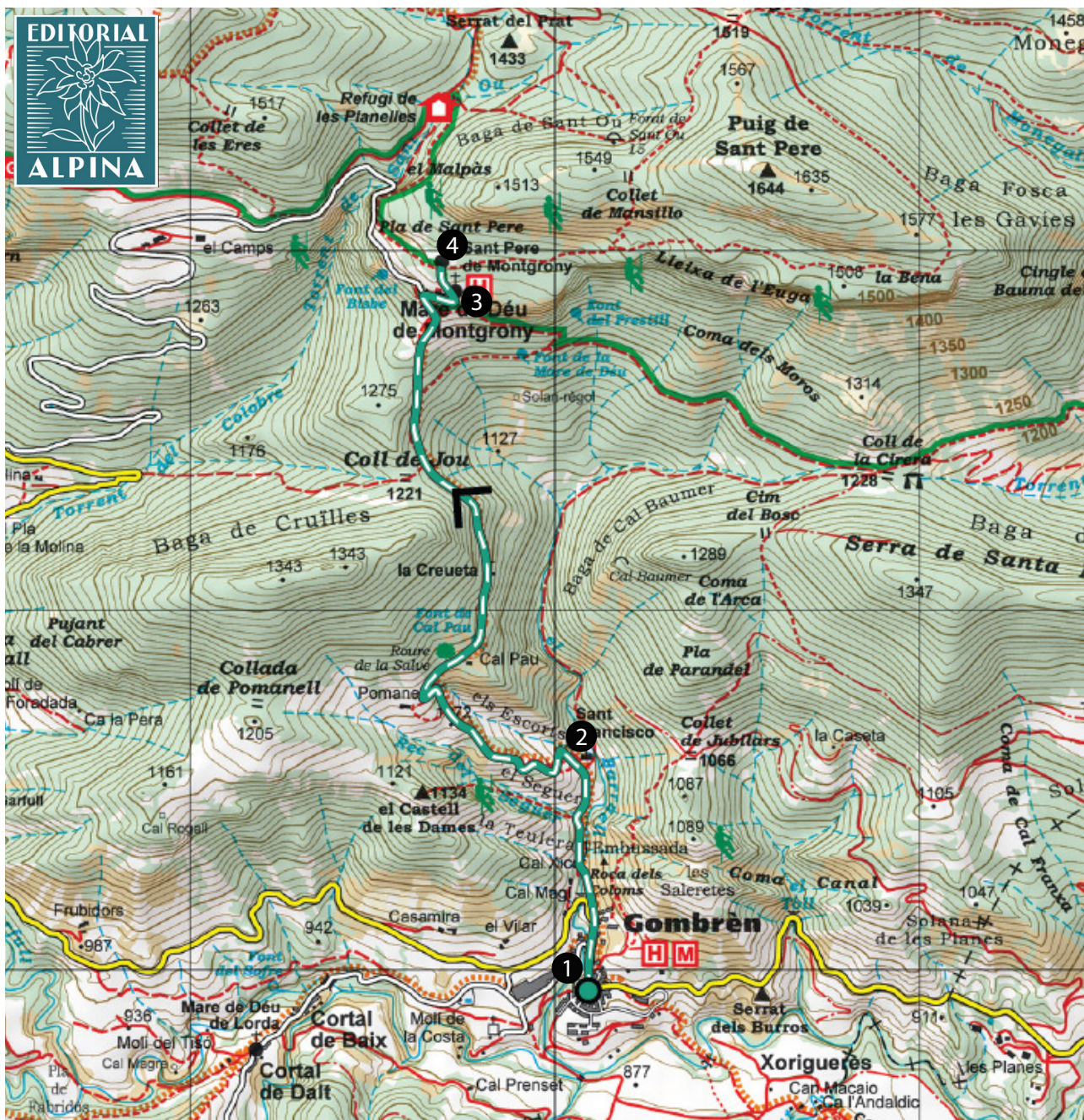
EDITORIAL ALPINA. Montgrony. 1:25.000.