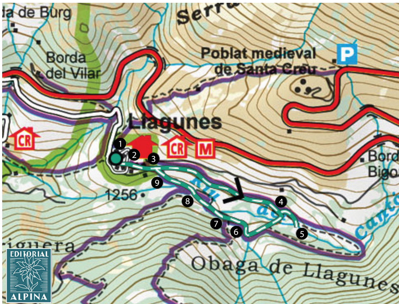
Parc Natural de l'Alt Pirineu. 1:50.000. Editorial Alpina.