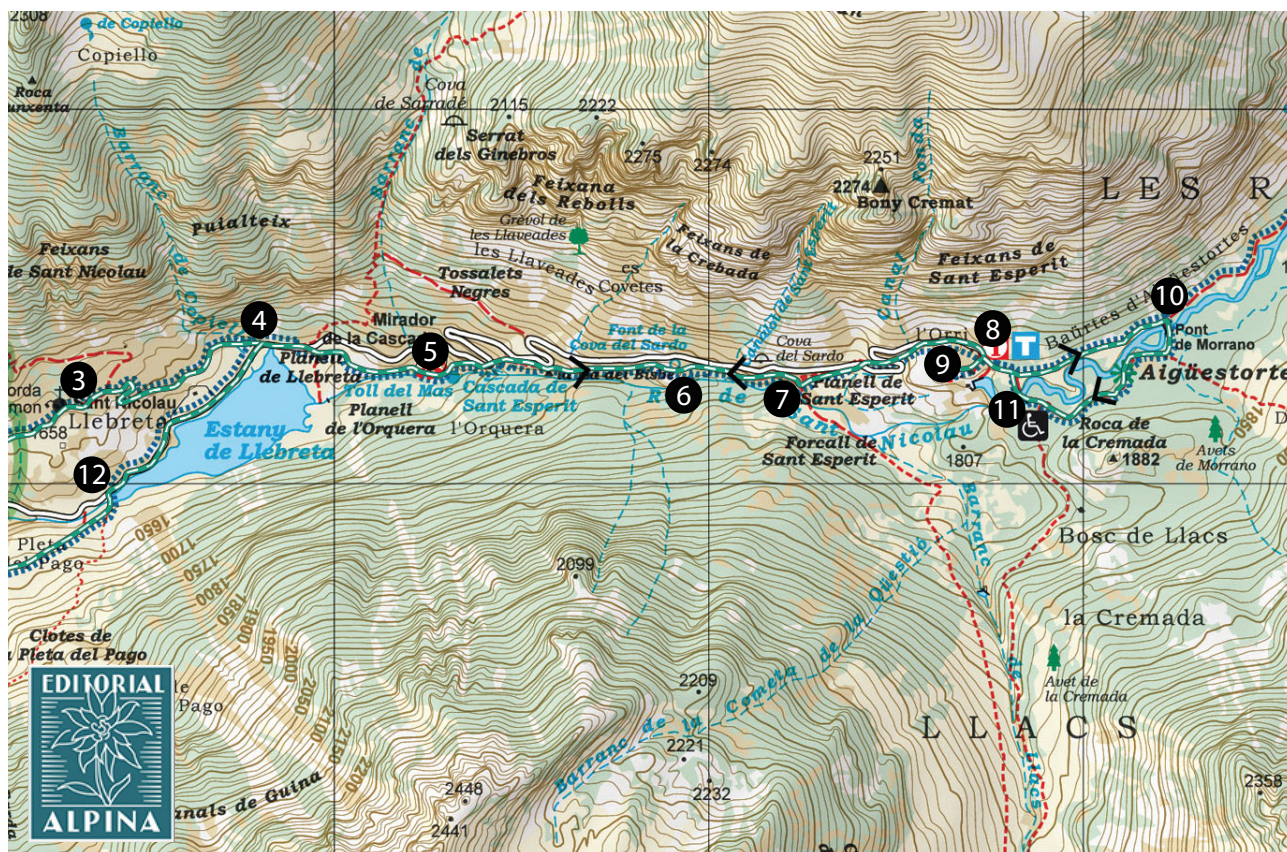
Parc Nacional d'Aigüestortes i Estany de Sant Maurici. 1:25.000. Editorial Alpina.