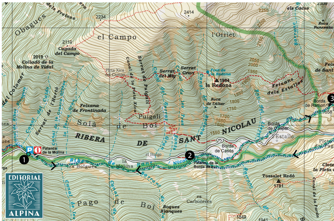
Parc Nacional d'Aigüestortes i Estany de Sant Maurici. 1:25.000. Editorial Alpina.