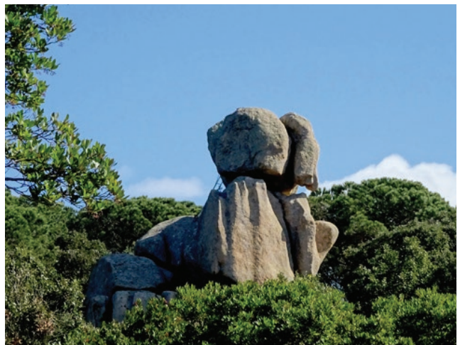
Puig de Cadiretes (519m) a l'Ardenya