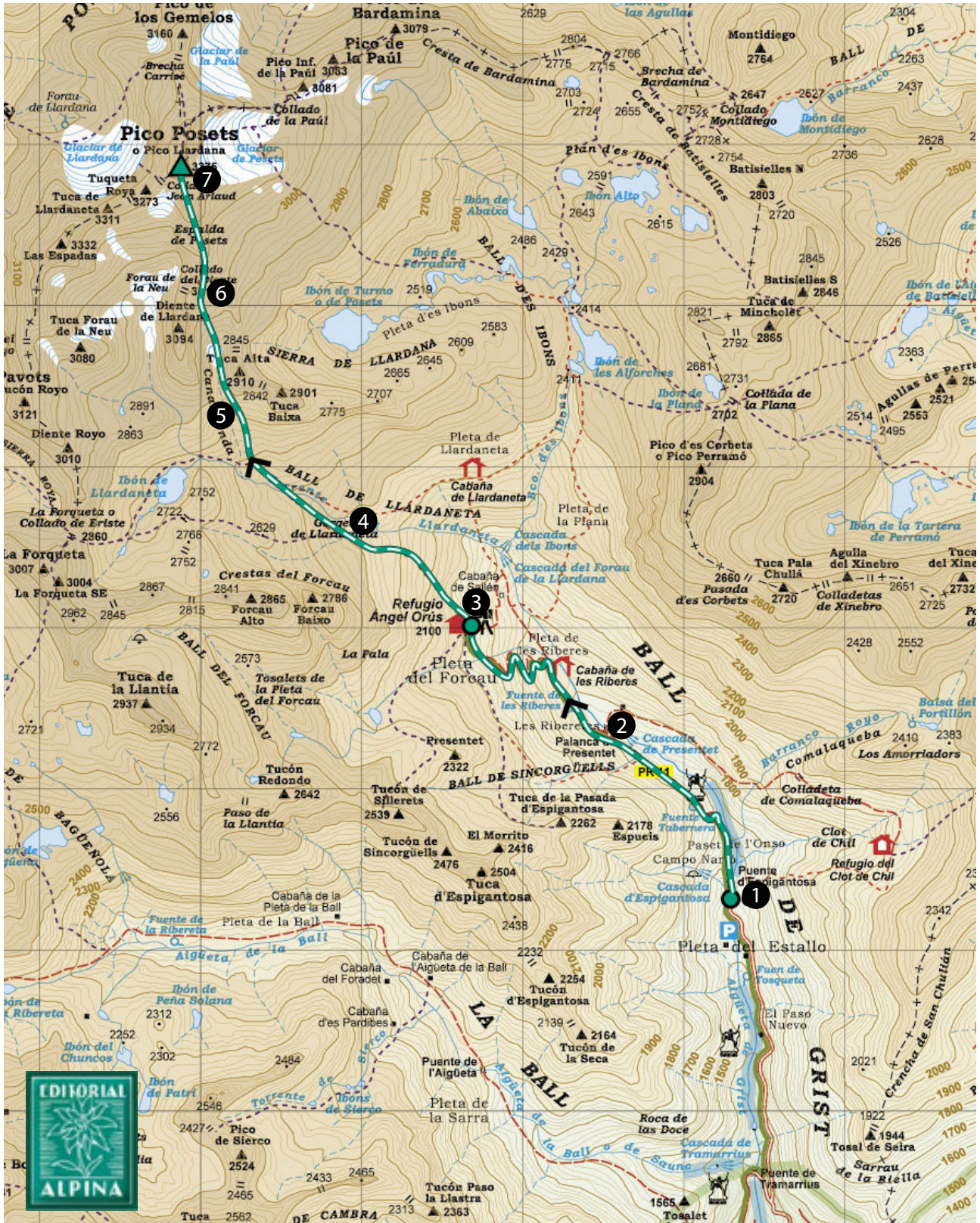
EDITORIAL ALPINA. Posets-Perdiguero. Valles de Benasque, Estós y Chistau. Serie E-25. 1:25,000.