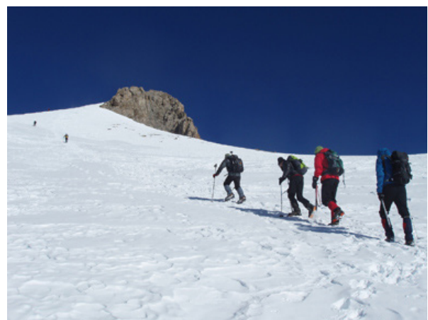
Posets (3.375m) pel refugi Àngel Orús