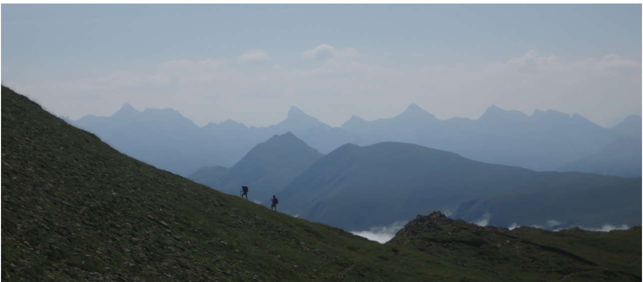
Pic Ori (2.017m) des del port de Larrau

El pic Ori, o també anomenat pic Orhi (i en francès pic Orhy), està situat a la capçalera de la vall de Salazar, al NE de Navarra, just a la frontera entre Espanya i França. És una de les muntanyes més conegudes i visitades del Pirineu de Navarra i de la zona de l'Alt Bearn. El pic Ori és la més occidental d'una llarga llista de muntanyes remarcables que s'eleven bruscament. Concretament, el pic és molt popular perquè és la primera muntanya dels Pirineus de més de 2.000m venint des de l'Atlàntic. Aquest fet dona entitat a la seva ascensió i també fa que des del seu cim puguem gaudir d'un gran panorama de Navarra, del País Basc i de l'Alt Bearn. La gran majoria d'aficionats a la muntanya que decideixen pujar fins al cim ho acostumen a fer des del port de Larrau, perquè és la manera més fàcil i ràpida de fer-ho. No obstant això, existeixen d'altres interessantíssims itineraris per fer la seva ascensió que també valen molt la pena.