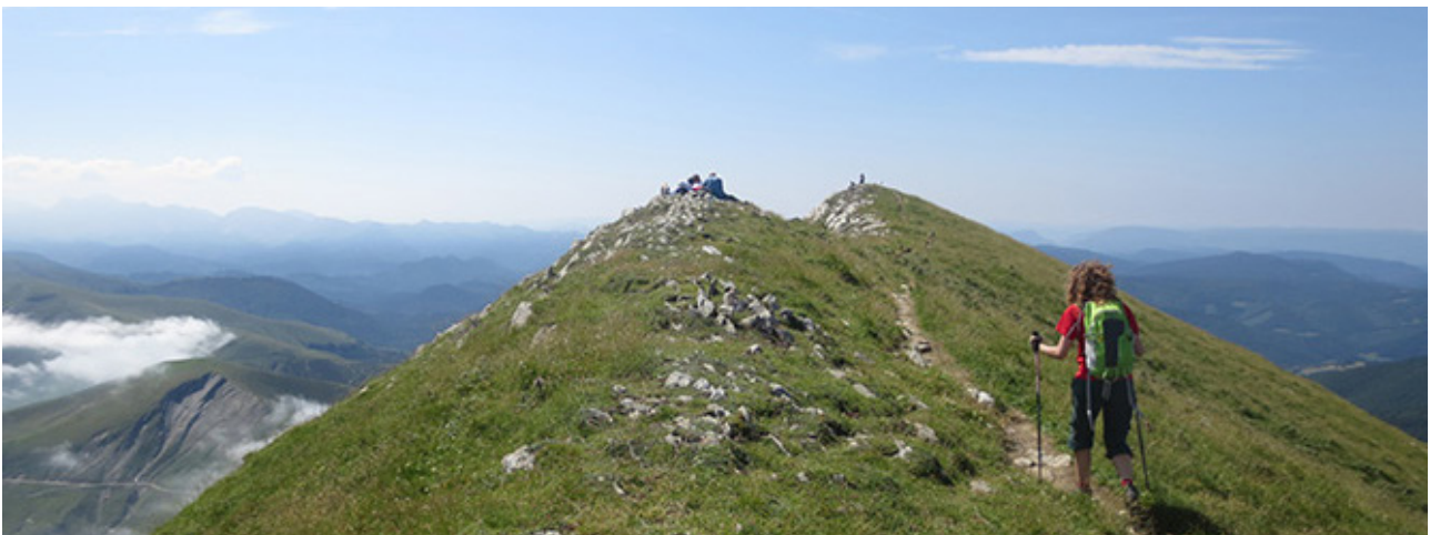
Pic Ori (2.017m) des del port de Larrau

Des de la cota S de l'Ori, comencem el descens. Baixem ara pel camí que ens porta directament fins al collet que hi ha entre l'Oritxipia i l'Ori . El descens és fort i acusat, les vistes són espectaculars. El camí fa diverses ziga-zagues i després se suavitzta. Seguim avançant i aviat arribem al trencall de camins per on hem passat a l'anada. Fem el camí de tornada fins al port de Larrau, ara de baixada. Necessitem una hora aproximadament des del cim per arribar novament al 1 port de Larrau (2:15h - 1.573m) .