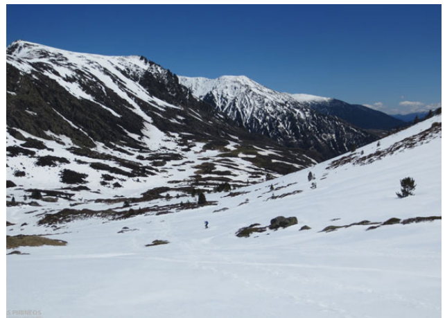
Pic de Nérassol (2.633m) per la vall de Siscar