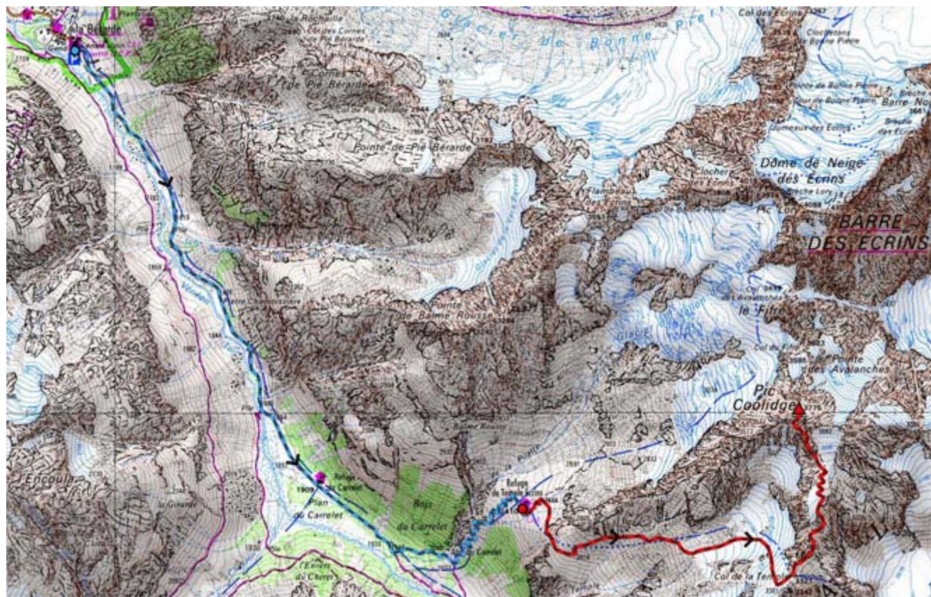
Mapa n°3436 ET Top 25. IGN propietat de l' Institut Geographique National