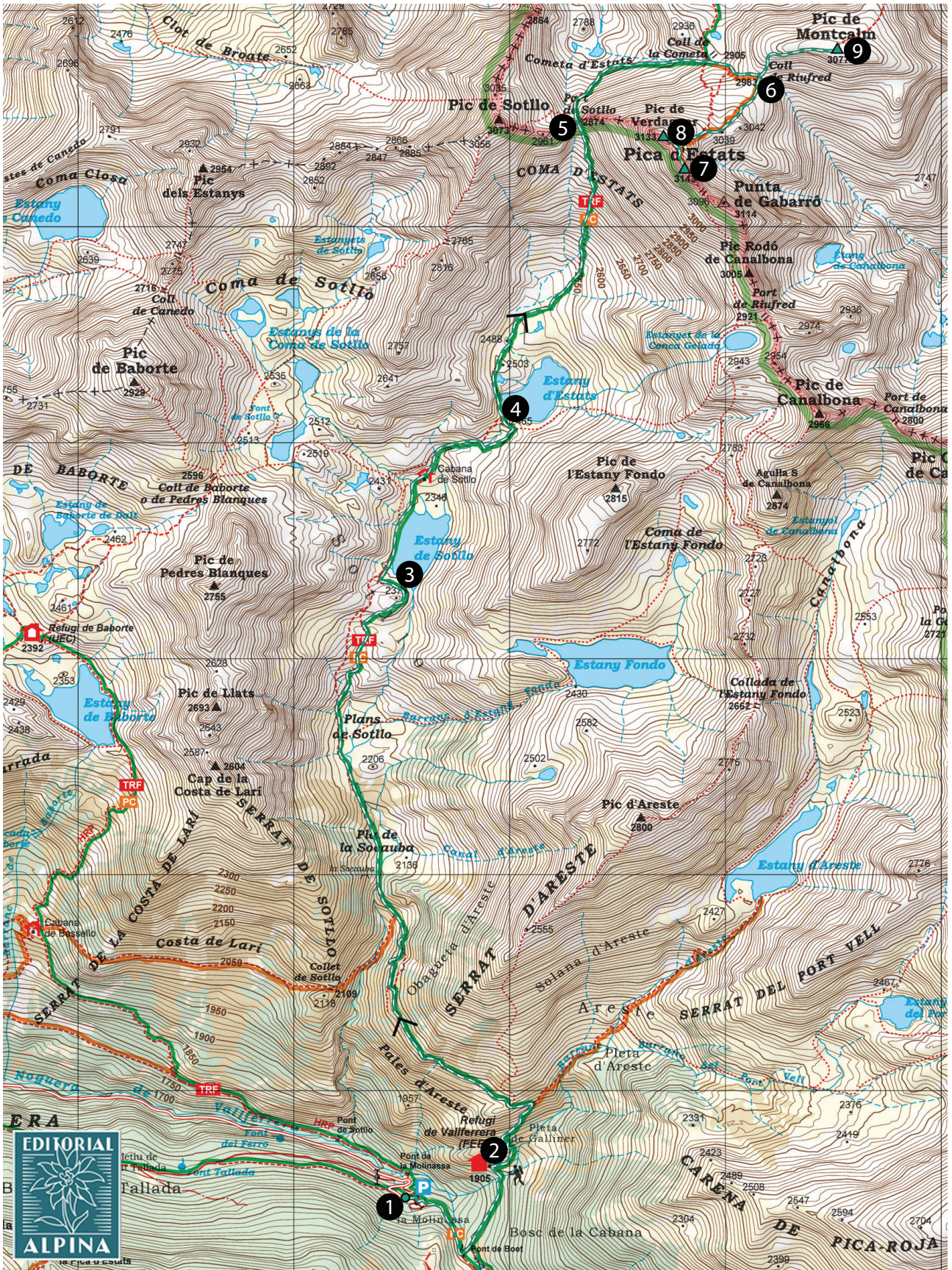
Pica d'Estats Mont-roig. Vall Ferrera-Vall de Cardós. 1:25.000. Editorial Alpina.