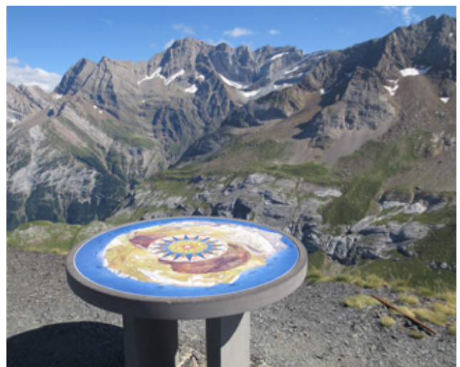
Pic de Tentes (2.322m) des del coll de Tentes