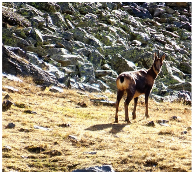
Pic de la Serrera (2.913m) per la vall de Sorteny