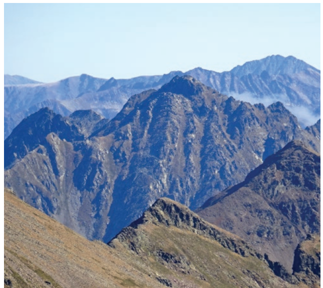
Pic de la Serrera (2.913m) per la vall de Sorteny