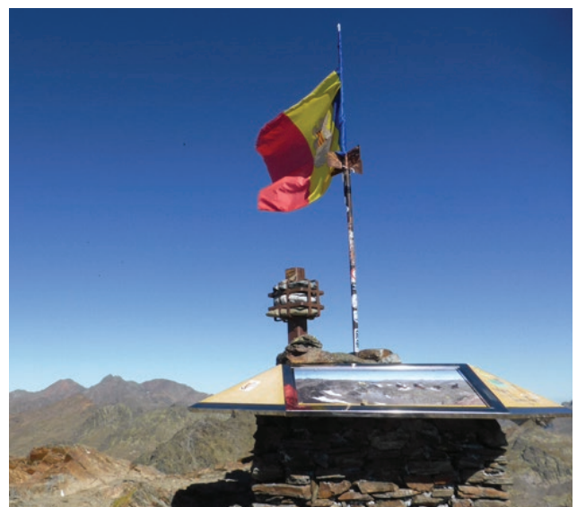
Pic de Comapedrosa (2.939m) des d'Arinsal