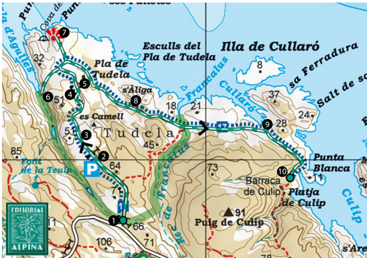
Cap de Creus. 1:25,000. Editorial Alpina.