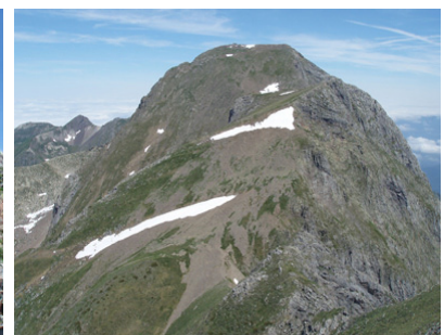
Mont Valier (2.838m) i pic de la Pala Clavera (2.721m)