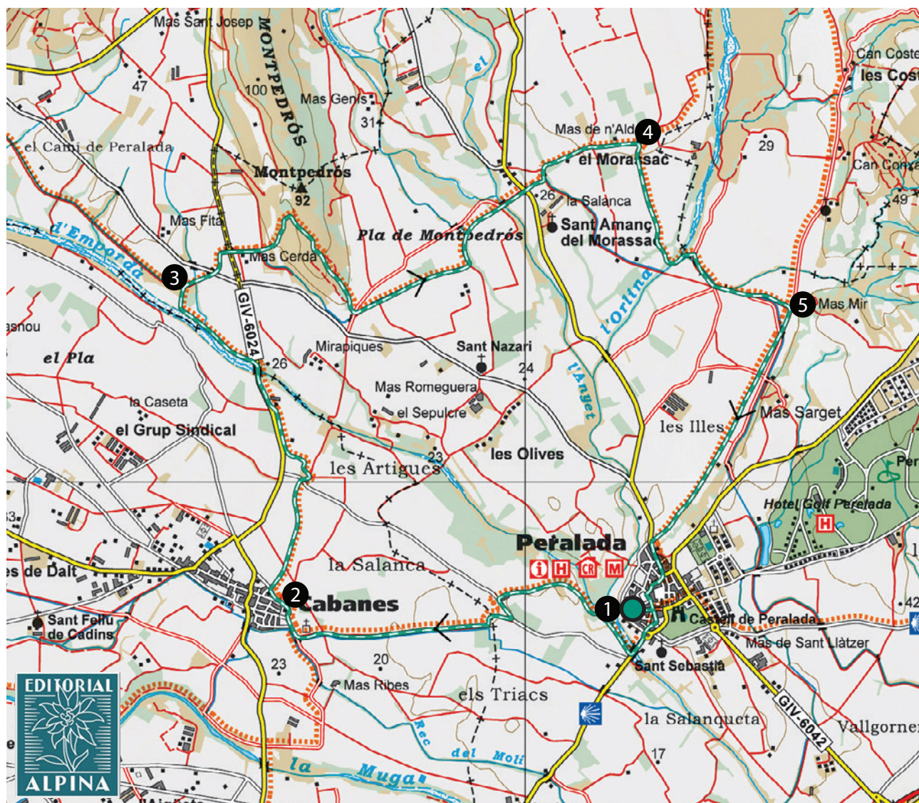
Alt Empordà. 1:50.000. Editorial Alpina.