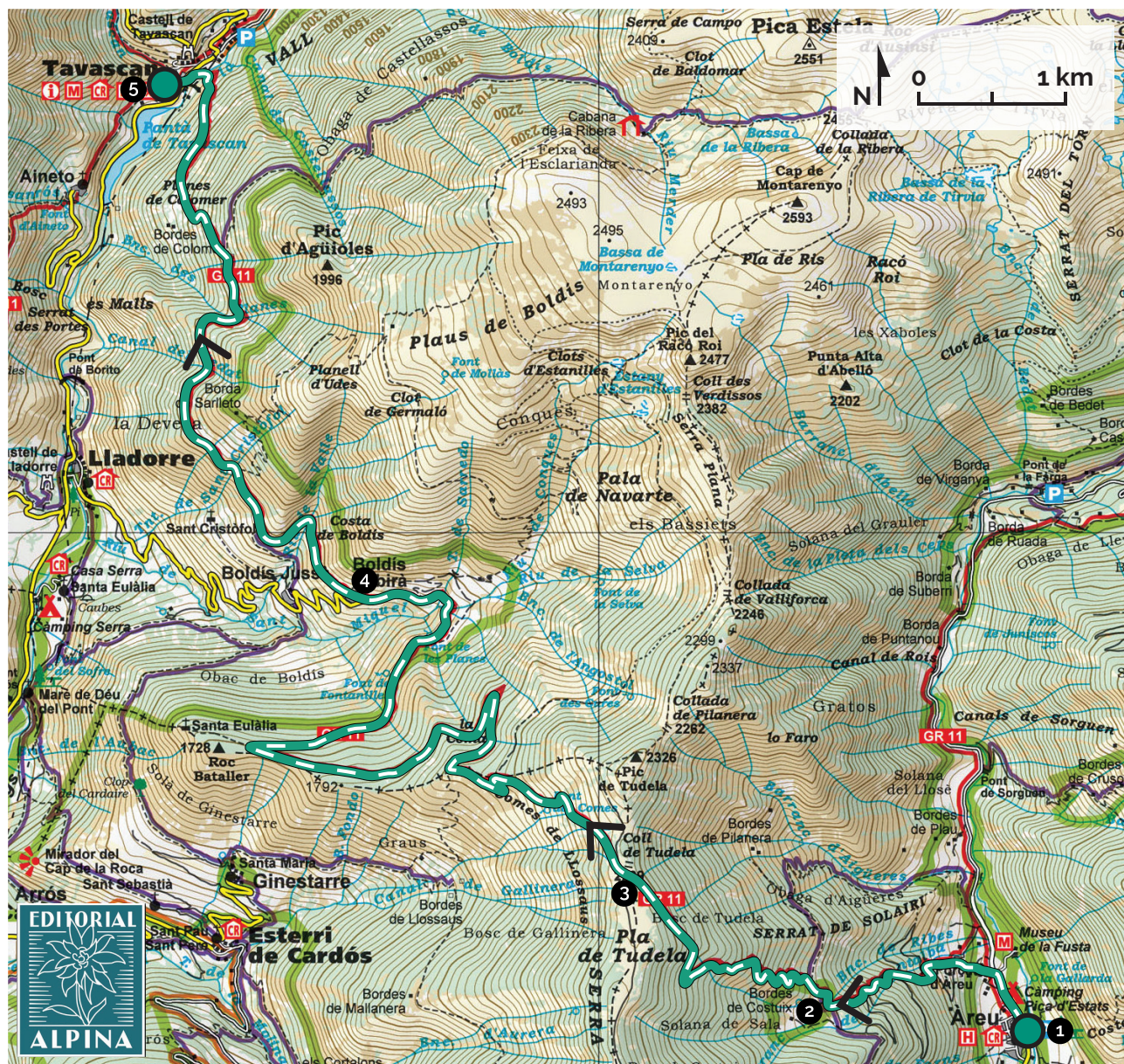
Parc Natural de l'Alt Pirineu. 1:50.000. Editorial Alpina.