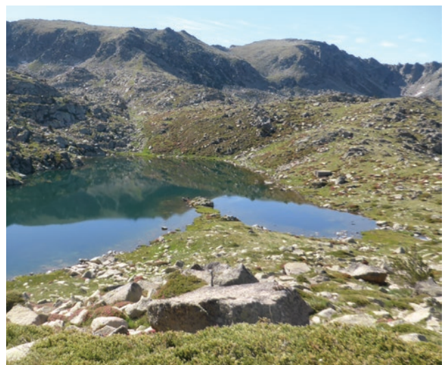
Estany de les Abelles i pics d'Envalira (2.823m i 2.818m)