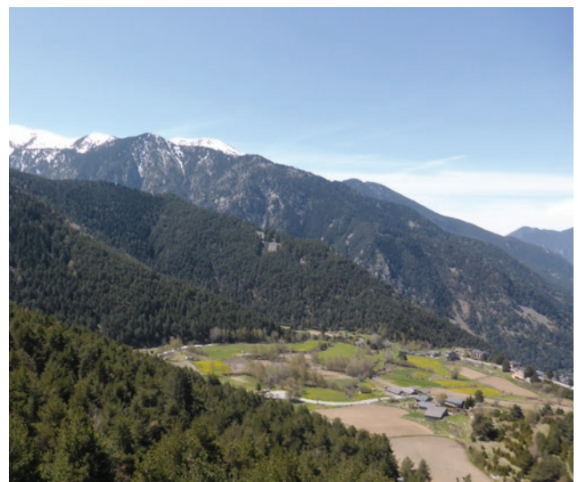
Estany de les Abelles i pics d'Envalira (2.823m i 2.818m)