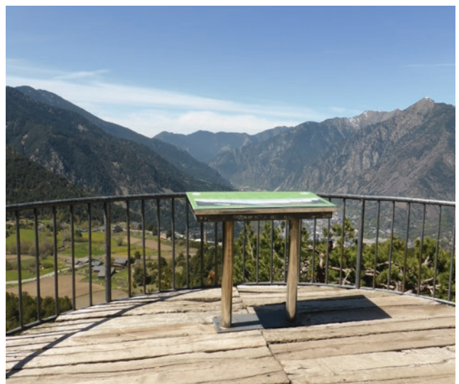
Estany de les Abelles i pics d'Envalira (2.823m i 2.818m)