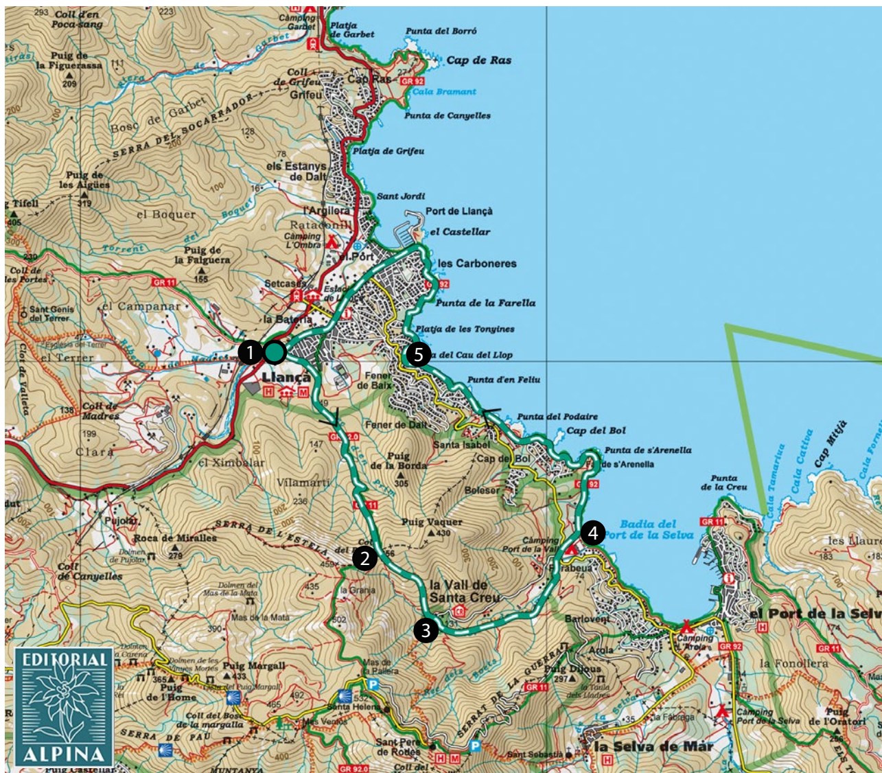
Alt Empordà. 1:50.000. Editorial Alpina.