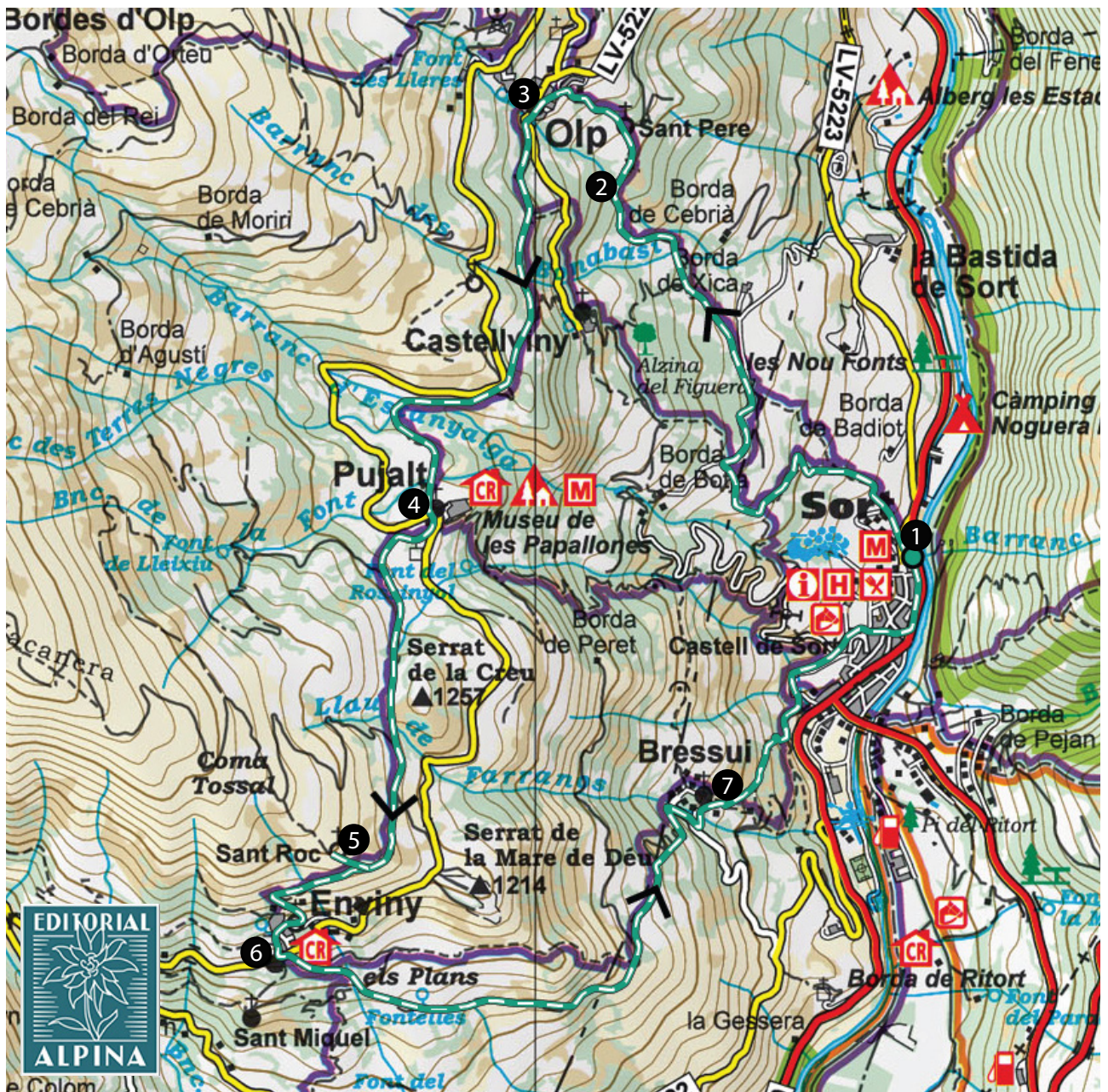
EDITORIAL ALPINA. Parc Natural de l'Alt Pirineu. 1:50.000.