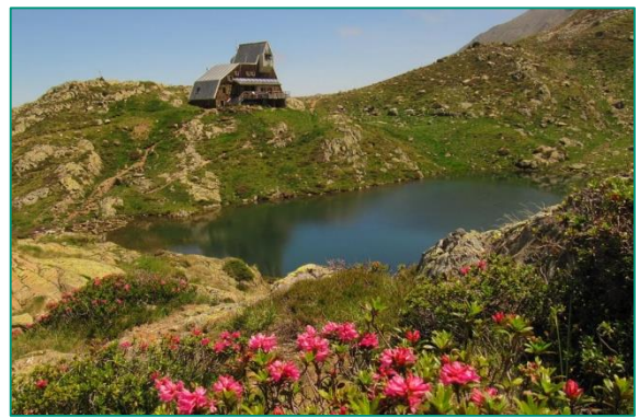
Refugi de Pinet, al vessant francès.