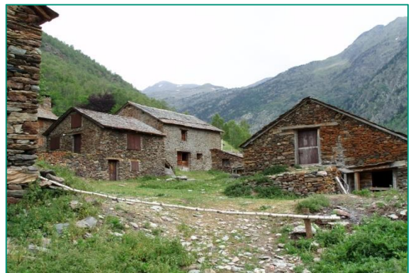
Bordes de Noarre.