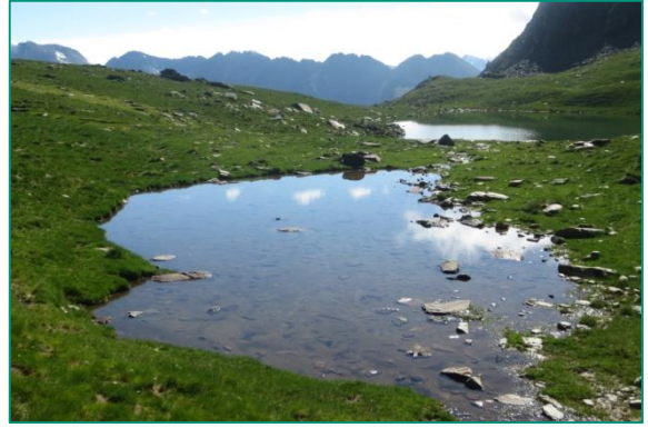
Petit estany a la zona de Certescan.