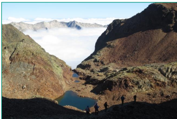
Coma d'Estats cerca del refugio de Pinet.