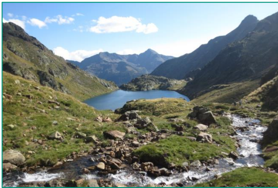
Estany de Sotllo, a prop del refugi Vallferrera