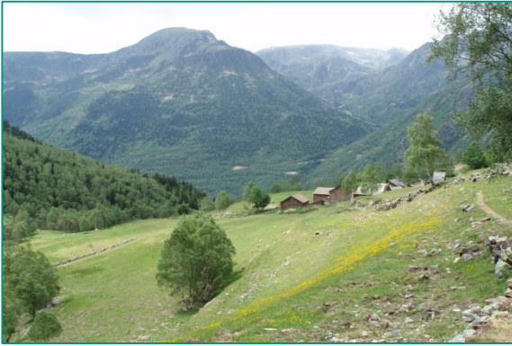
Vall de Tavascan.