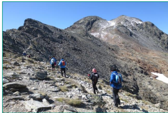
Ascendint a la Pica d'Estats.