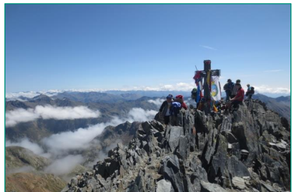
Cim de la Pica d'Estats (3.143m).