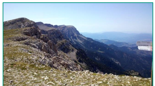
El Pas dels Gosolans, important port de muntanya.